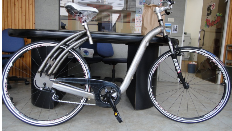
Fig 4 : le prototype

Le SWICLE®, c'est finalement un prototype (fig 4) :