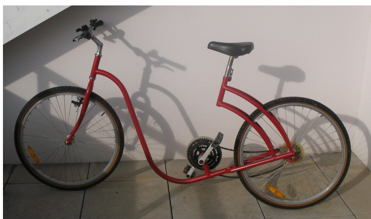
Fig 3 : l'échantillon

Le SWICLE®, c'est ensuite un échantillon réalisé dans un garage (fig 3) :