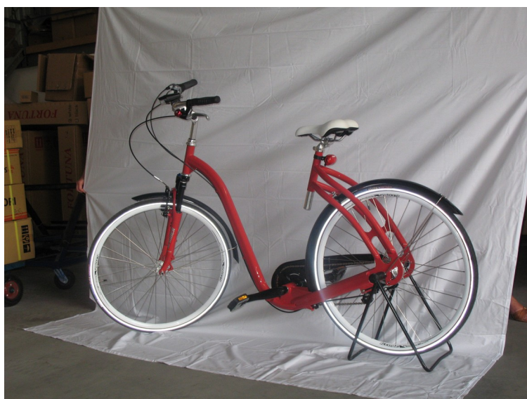
Fig 1 : le SWICLE

Le SWICLE® se distingue par la ligne de son cadre qui fait l'objet d'un brevet de design industriel : il se caractérise par l'absence du tube de selle s'appuyant sur le pédalier de sorte que sa ligne ressemble à une courbe ouverte qui part et revient ; une courbe qui ressemble à la moitié de l'infini.